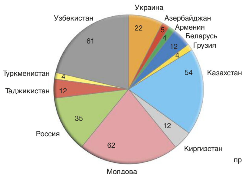
Проекты по странам СНГ в 2010 г