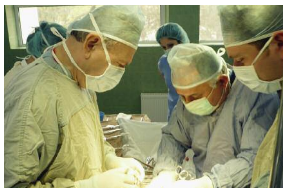
Старший эксперт д-р Отто Штэли повышал квалификацию хирургов в одной из грузинских больниц.